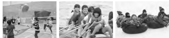
※写真は昨年度のものです。