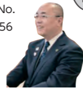
南陽市長 白岩 孝夫