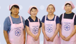
沖郷地区食改の皆さん

おかひじきは、栄養価が高くビタミンやミネラルが豊富です。お浸しで食べることが多いですが、和え物や炒め物にしてもおいしくいただけます。