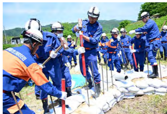
▲令和8年5月17日に開催された水害対応訓練

令和6年7月に山形県を襲った豪雨では、7市町村に大雨特別警報(浸水害)が発令され、最上川上流では氾濫危険水位を超過しました。今年も間もなく出水期を迎えますが、万が一の災害に備えた日頃からの意識と行動が大切です。「自分の命は自分で守る」を基本として、災害について家族や地域で話し合い、災害に備えましょう。