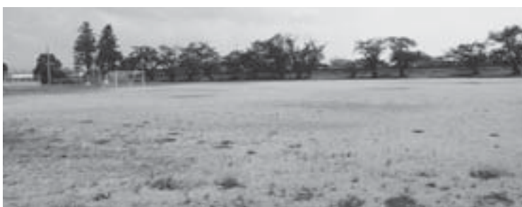
赤湯中サッカー部が使用している元赤湯小グラウンド