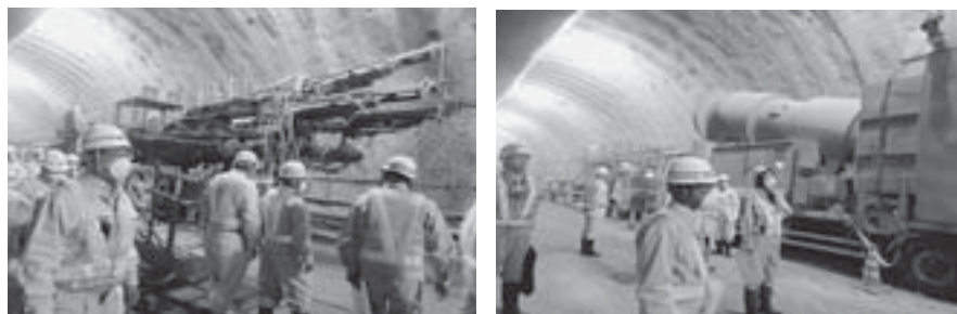
トンネル坑内の大型機械

ジャンボなどの専用大型機械や発破後のナマの現場を見聞した。1カ月約100mの掘削で現在500mまで進み、残り1.2km。大規模な換気装置で作業環境に配慮して安全第一で施工しているとの説明を受けた。