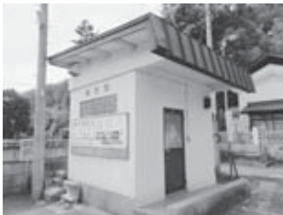
御神坂下の公衆トイレ

◎公衆トイレで特に、烏帽子山公園の御神坂下のトイレはひどいので早期の改修を。〈市民課長〉建て替えを検討したい。