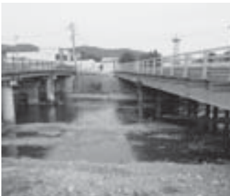
花見橋現橋と仮橋(右)