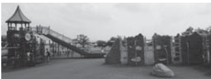
木陰のない花公園ドリームランド