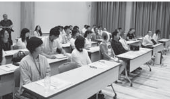
7/2 プロジェクト実行委員会設立

南陽市の強みの一つであるラーメンを主役にし、南陽市のラーメンのおいしさを情報発信して知名度アップを図る。実行委員会を組織して交流人口増加と魅力あるまちづくりを目指す。今年度は店舗数の把握と、ラーメン店マップを作成する。