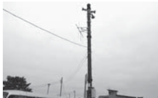
防災無線スピーカー

〈総合防災課長〉7月1日号の市報で告知する予定。ホームページの活用や地区長会などの場でも周知を行う。また、各家庭に対するチラシ等も検討中。