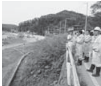
金山工区での現地説明