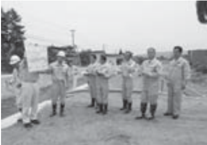
四ツ谷橋付近での現地説明

26年7月豪雨と同等の雨量でも溢れない、河川断面を確保するため河道の拡幅、河床掘削を行っている。全体的には29年度内に完了。また、市道四ツ谷線四ツ谷橋は7月頃完成の予定。