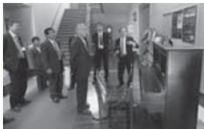
結城豊太郎記念館

また、併設のデイサービスセンターの利用状況は、定員15名で、平均利用者は11.5名とのこと。