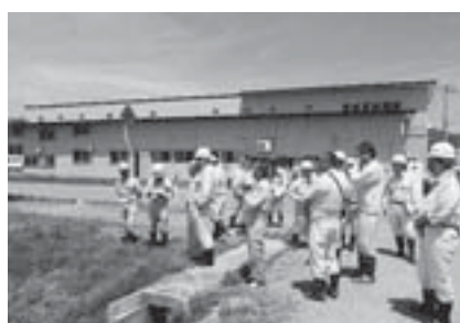
漆山地区内での現地説明