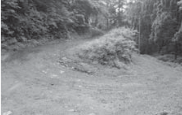
大型車両の入れない現道

指定鉱害防止事業者で実施する長ヶ沢ダムの対策工事に関して、円滑に取り組めるよう道路整備を支援するもの。