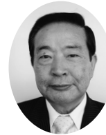
副議長 川合 猛氏