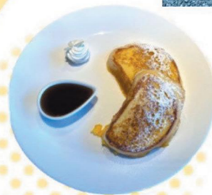
ふわふわフレンチトースト/¥500

こだわりはできるだけ地元の食材を使用すること。オススメメニューはふわふわフレンチトースト。名前の通りふわふわでとろとろ。メイプルシロップをお好みでかけて食べることができる。