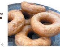
全粒粉プレーンドーナツ/¥230

宮内にあるドーナツ専門店。"特別なものよりもまた食べたいと思ってもらえるものにしたい"という思いから、普段の暮らしに寄り添う身体にやさしい商品を販売している。今日は家族でま〜るくドーナツを囲んだ食卓にしてみませんか。