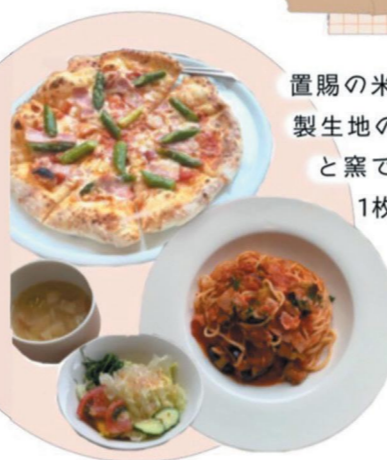
ピッツァランチ/¥1100 パスタランチ/¥990

置賜の米の米粉を使用した自家製生地のピッツァは、じっくりと窯で焼き上げたもちもちの1枚。自家製の生麺を使用したパスタは、もちもちながらもコシがあり食べごたえばつぐん。