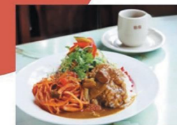
★店内のイチオシメニュー Bセット(ナポリタン+カレー)/¥900

昭和25年にオープンした昔からの喫茶店。現在は3代目の店主がお店を営んでいる。店内はレトロな暖色の空間になっていてお店の中にある大きな窓ガラスからは春は桜、秋は紅葉を楽しむことができる。