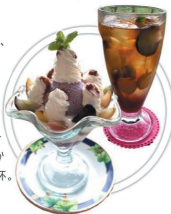
ぶどうパフェ/¥820 ぶどう園のぶどうたっぷりアイスティー/¥650

パフェでは生のぶどうの他に、冷凍、ドライフルーツ、ゼリーなど様々な形に変身したぶどうをひとつの皿で楽しめる。アイスティーはオーナー自ら「Sir Thomas LIPTONティーコーディネーター」を取得し、毎朝茶葉から入れているこだわりの1杯。店内で作ったジェラートやスイーツも購入できる。