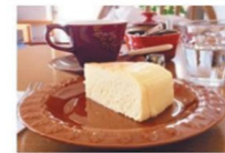
きなりブレンドとケーキのセット/¥780

店主のこだわりは品質が最上級のスペシャルコーヒーを使用していること、ケーキなどのスイーツは手作りで新鮮なものを提供していること。