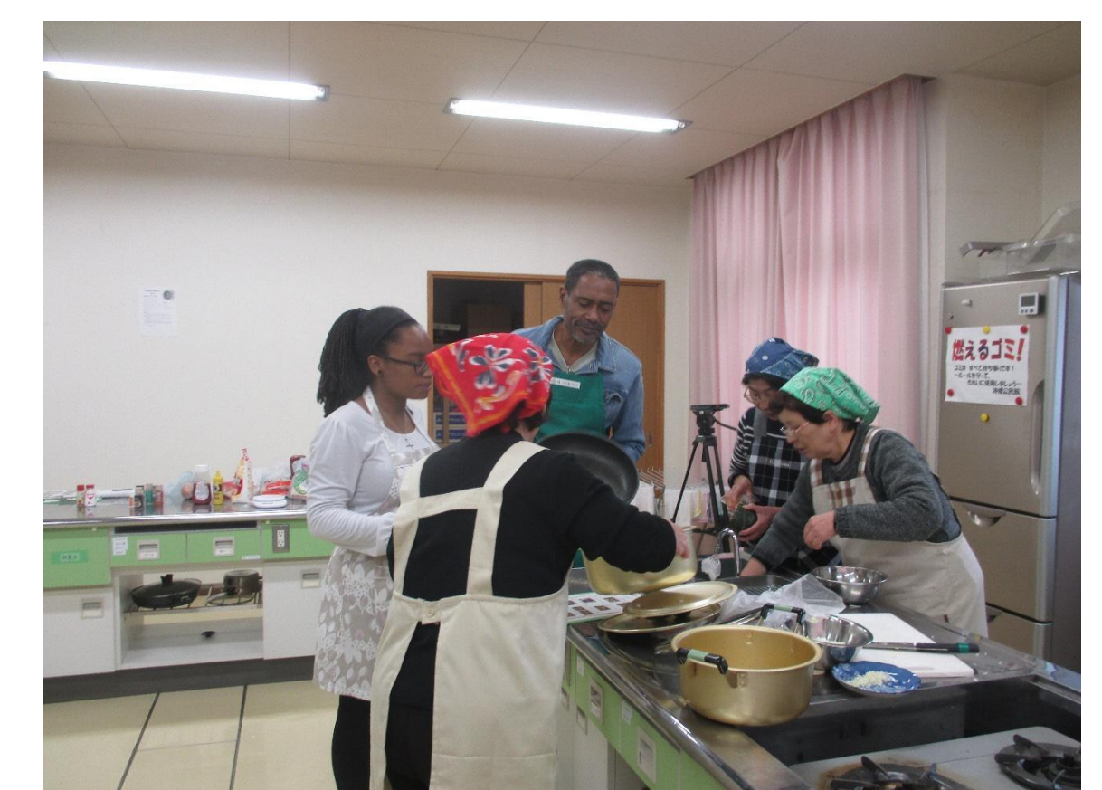
食を知ることは文化を知ること！間もなく完成！