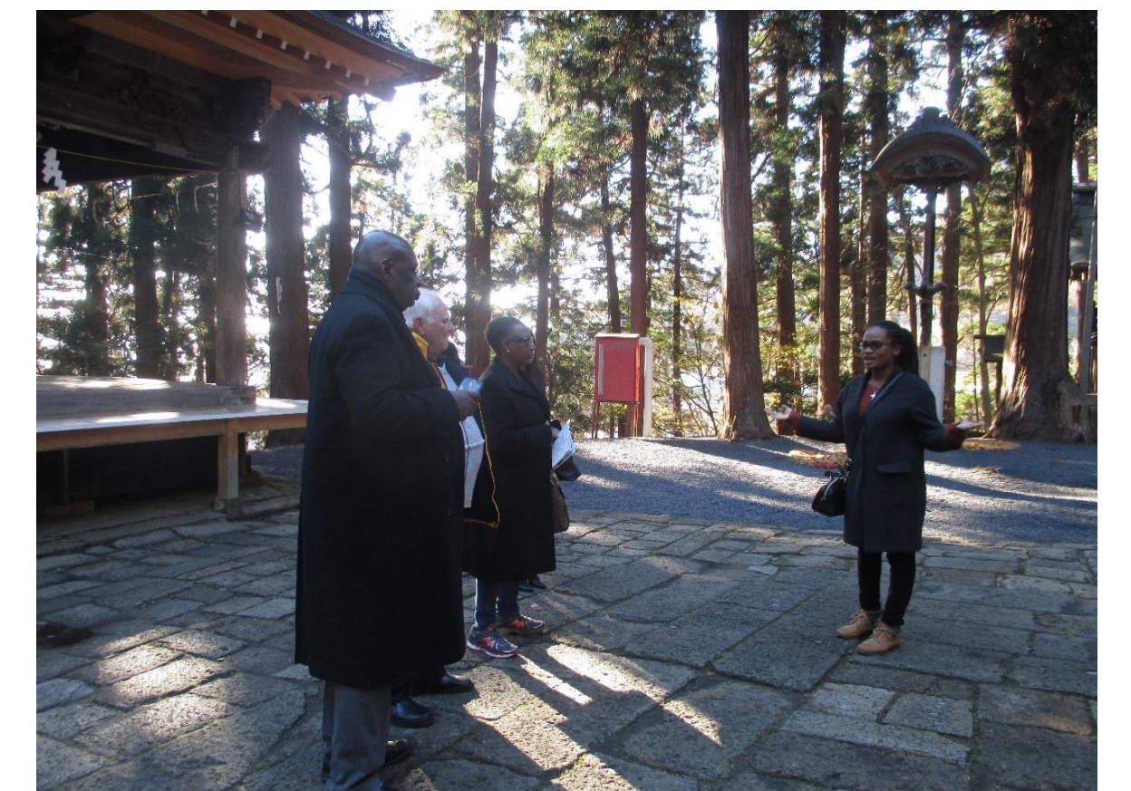
東北の伊勢 熊野大社で必勝祈願