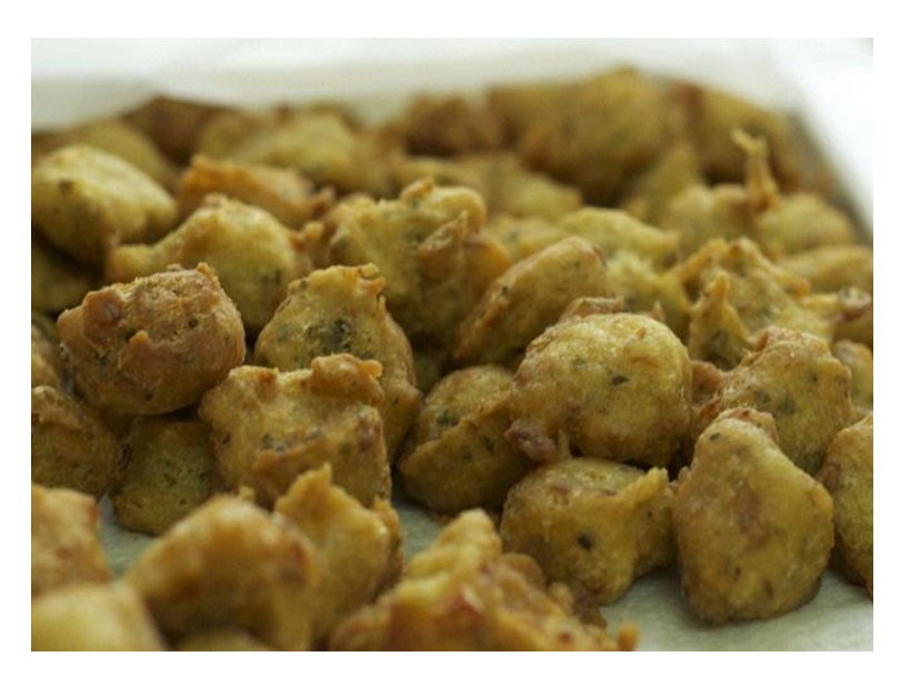
フィッシュケーキ