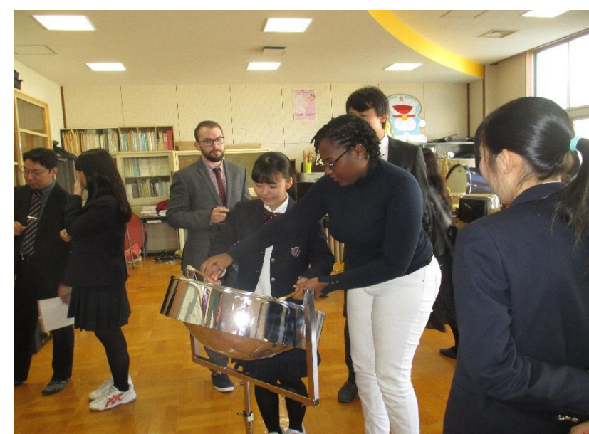
南陽高校：吹奏楽部との交流