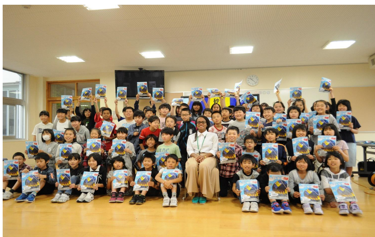
集合写真！子供たちの笑顔が印象的！

市内小中高校11校全12回実施。約1320名にバルバドス国の紹介を行う。子供たちはカリブ海の島国に興味津々、質問が途切れませんでした。南陽高校では、英語で質問する学生もいました。