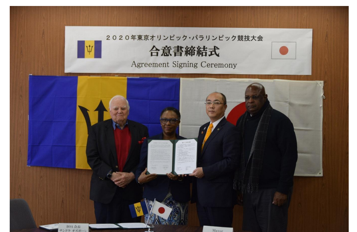
事前キャンプ合意書締結！いざ2020年へ向けて！