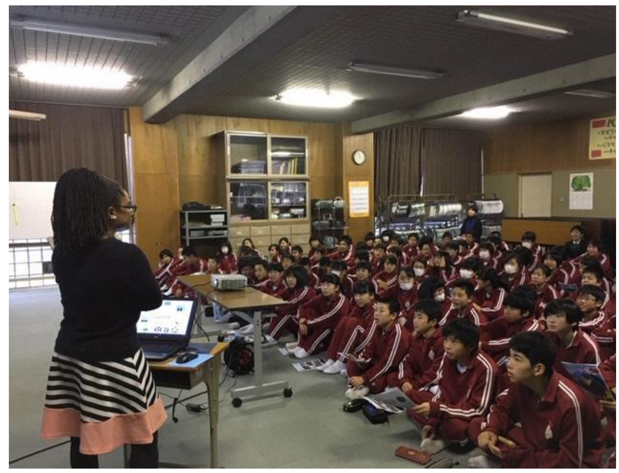
中学生：ドーン国際交流員の髪形に興味あり