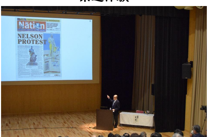
大使ご講演「バルバドスの歴史-現在」