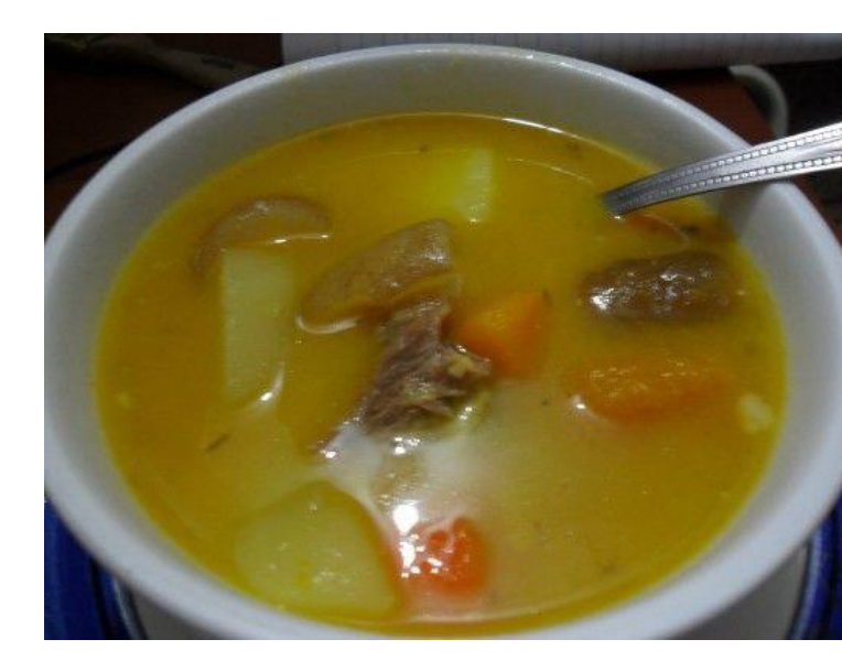
ベージュンスープ