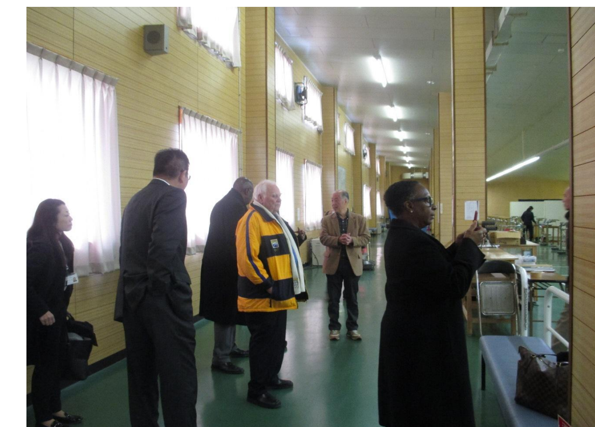
ライフル射撃場を視察