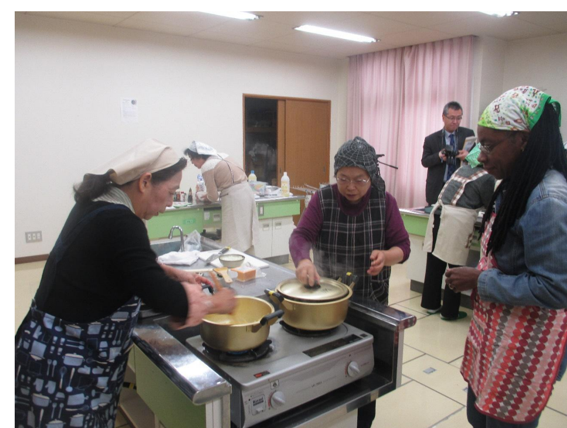
来日中のドーン国際交流員のご両親も