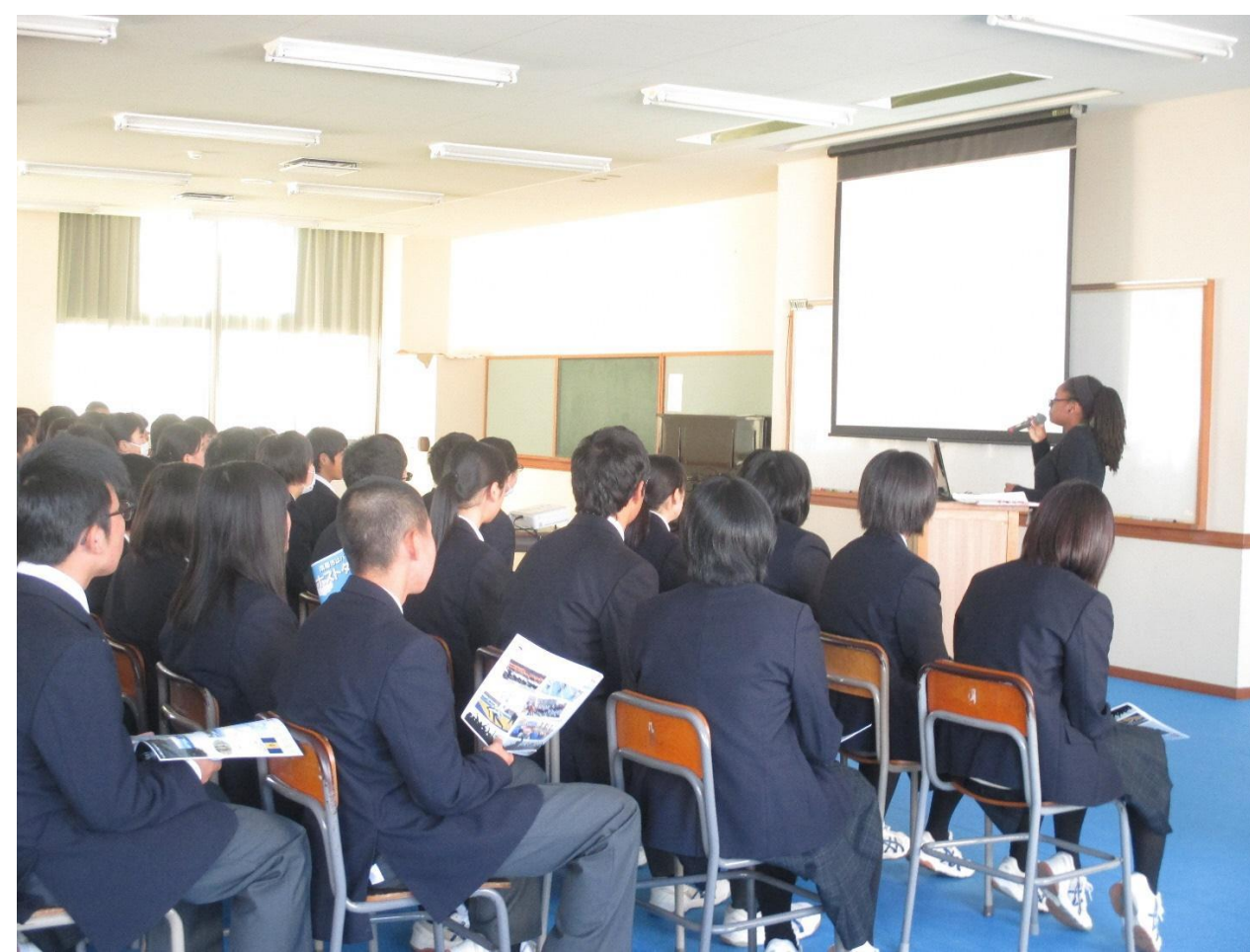
高校生：バルバドスはどこか知っていますか？