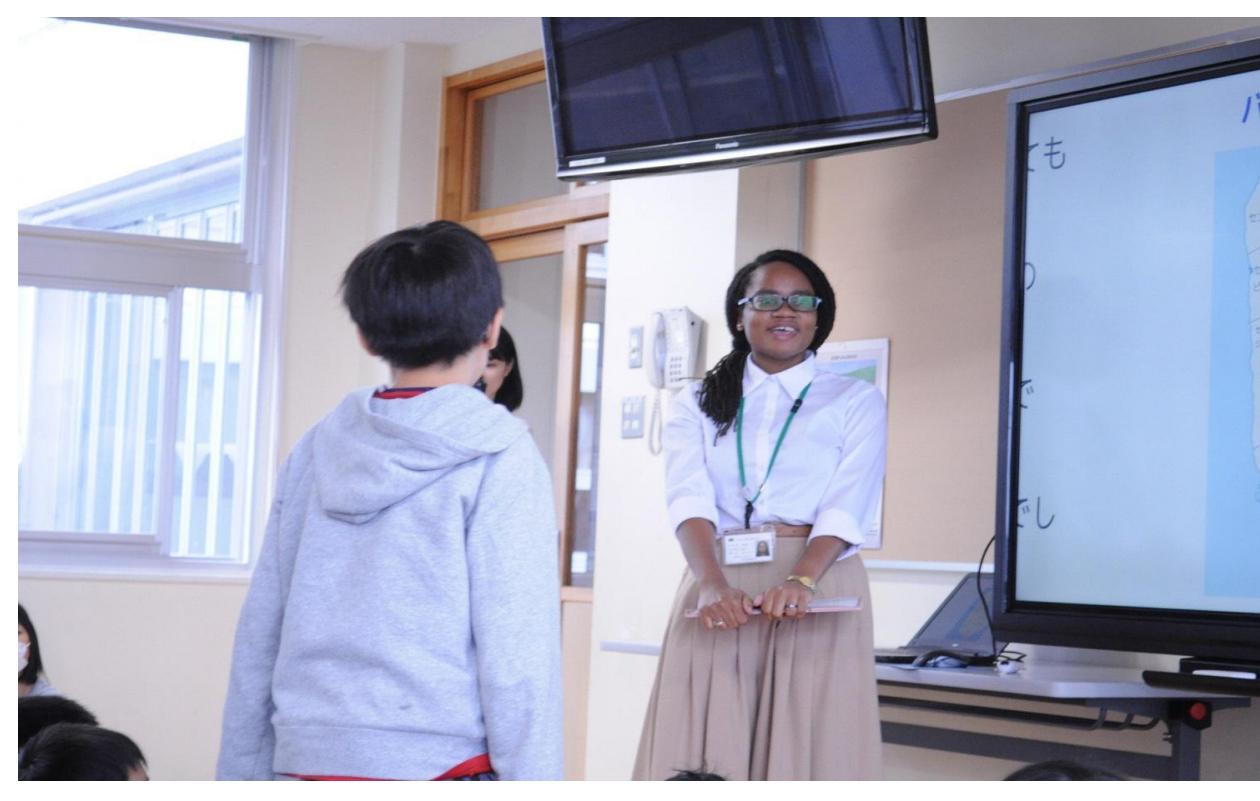
質問！バルバドスに行くにはいくらかかりますか？