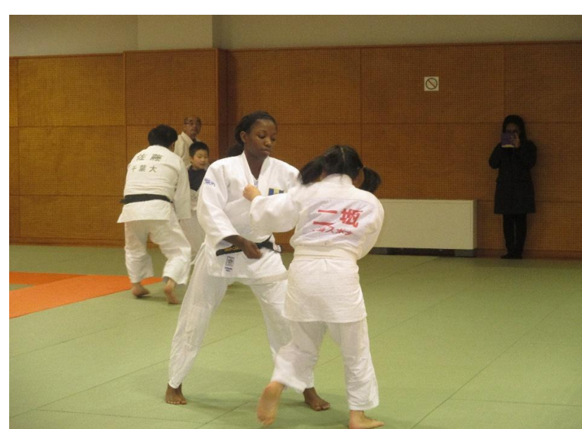
柔道連盟との稽古

陸上・柔道のアスリート2名、カリブ海の楽器スティールパンの演者1名来市。シンポジウム(約180名参加)、市民との交流を行いました。シンポジウムでは品田駐バルバドス日本国特命全権大使の講演も。