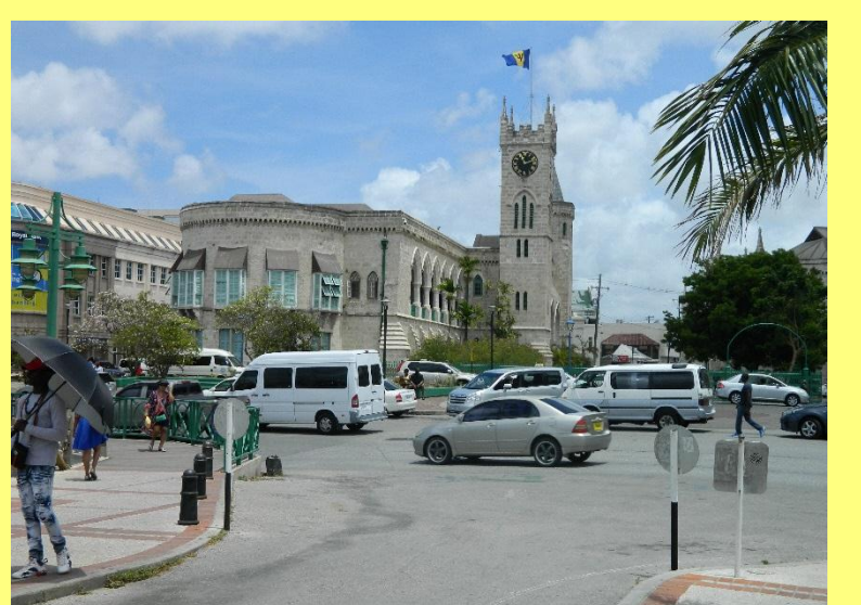
バルバドスの議院