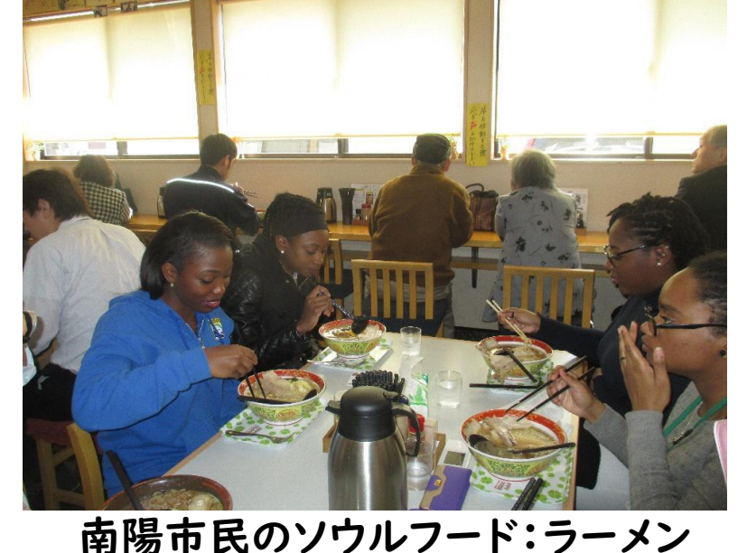
南陽市民のソウルフード：ラーメン