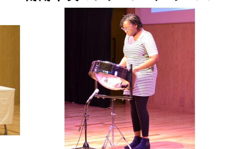
スティールパンの演奏：カリブ海の音色に感動