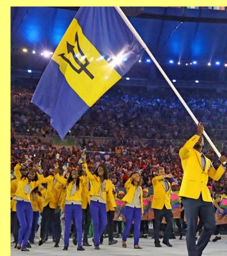
前回リオ大会バルバドス選手団