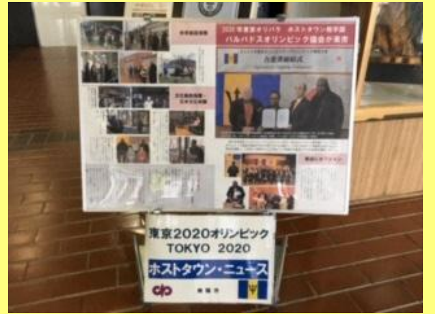
ホストタウンニュース