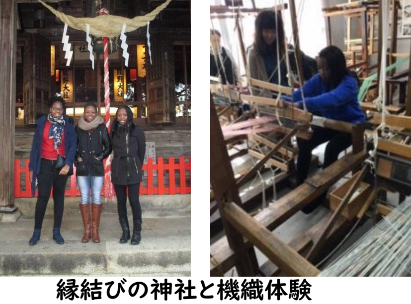
縁結びの神社と機織体験