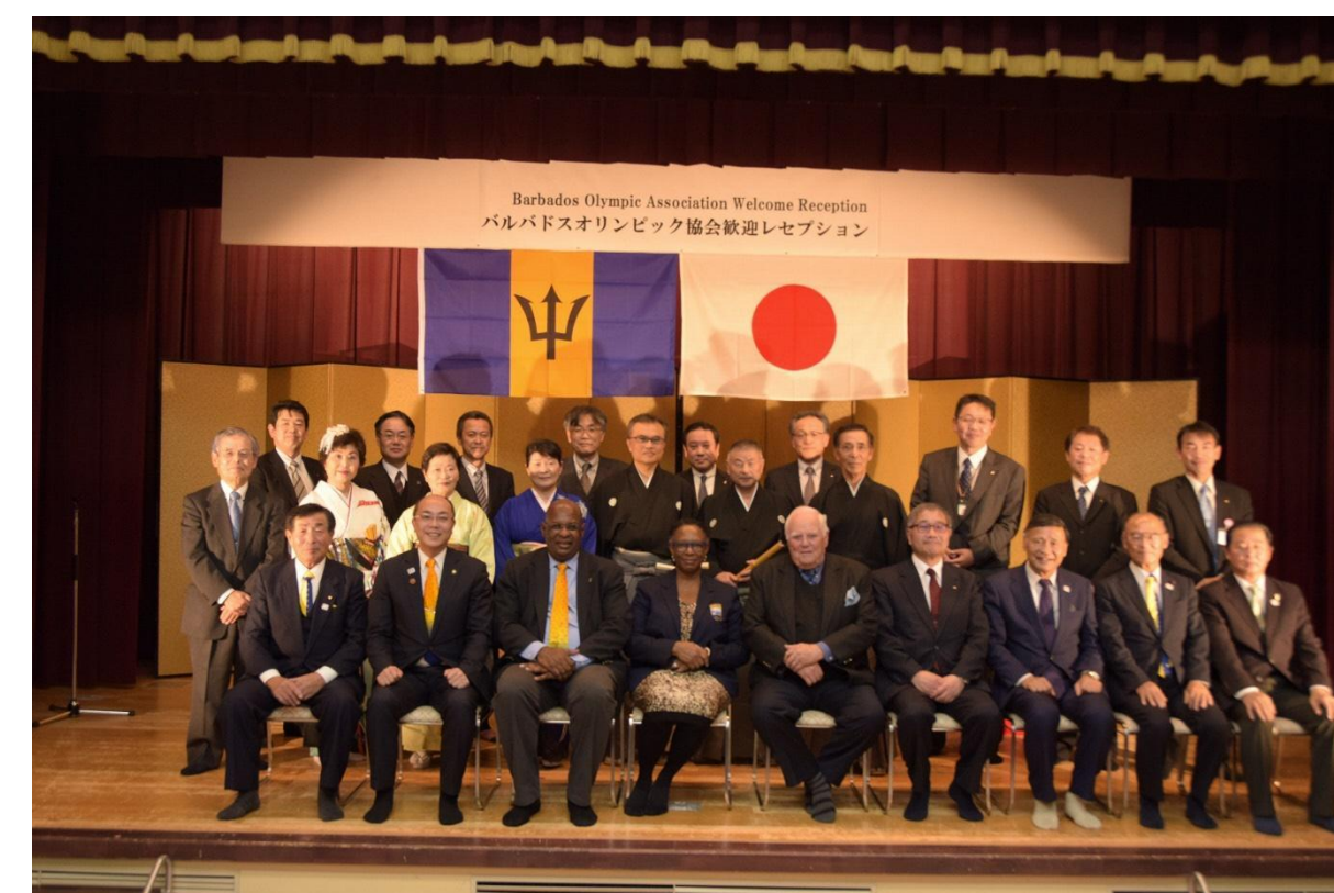
歓迎レセプション。実行委員会の皆さんと。

BOAのオズボーン会長始め3名来市。体育施設、文化施設を視察。事前キャンプ地を南陽市とする合意書を締結。歓迎レセプションでは、日本舞踊や三味線など日本文化に感動されていました。