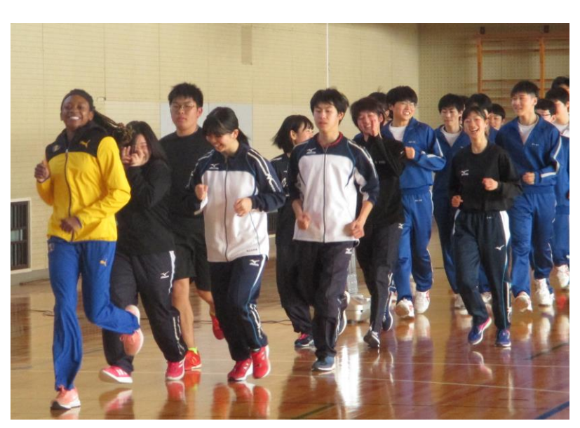
南陽高校：陸上部との交流