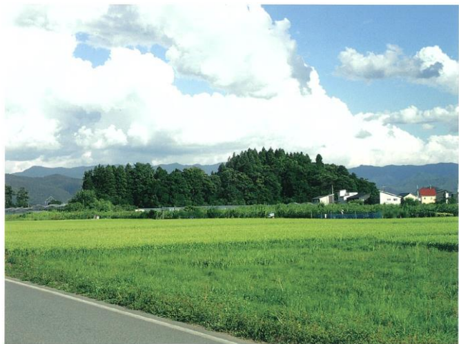
長岡南森遺跡全景（西から）