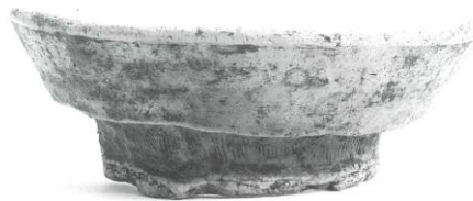
出土遺物（二重口縁壺※10）