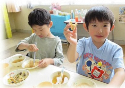
「たべたら ハートになったよ♡」