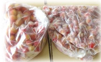
給食の先生が冷凍してくれました