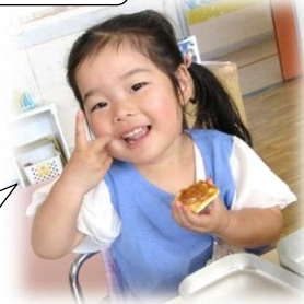
おいそう だなあ♡ ペロ“